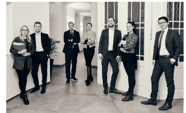
Das Corporate und M&A Team von CHG